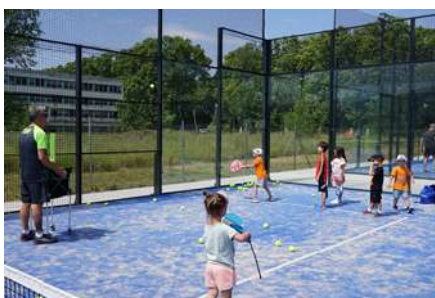
Iniciació al pàdel infantil