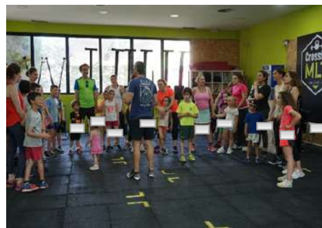
Crosffit en família