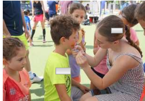
Pinta – Cares