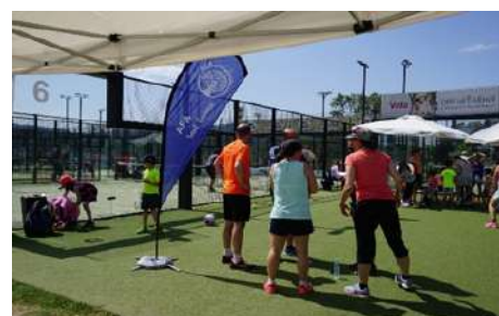
Iniciació al pàdel de pares i mares