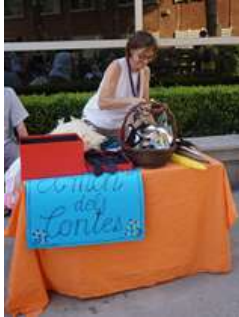
Taller de disfresses club de lectura