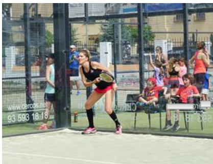
Americana de Pàdel