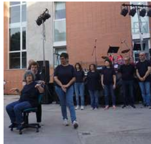
Actuació del Club de Teatre