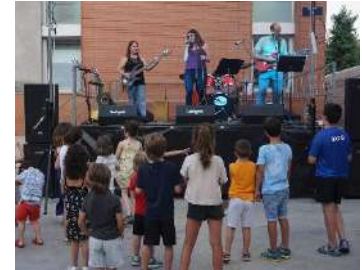
Actuació del Club de Música