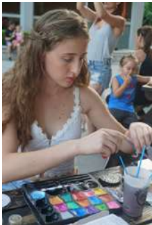
Pinta-cares Festa d'aigua