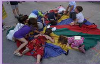
Animació amb activitats